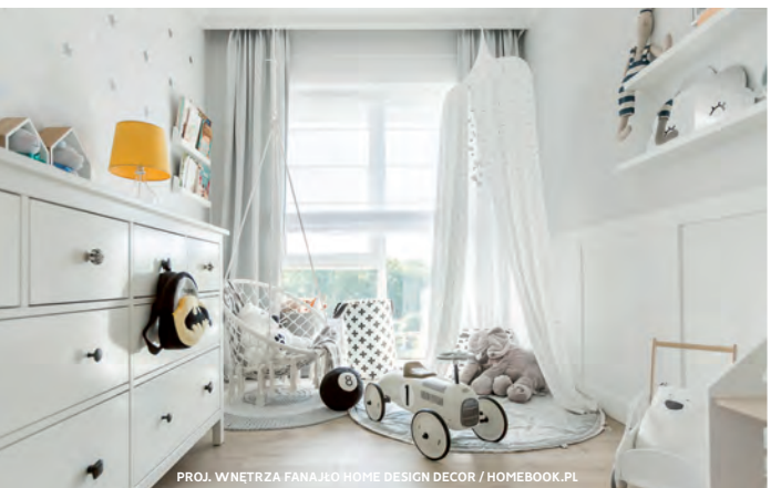
PROJ. WNĘTRZA FANA/JO HOME DESIGN DECOR / HOMEBOOK.PL

Niezbędne mebelki i elementy wyposażenia pokoju dla dziecka.