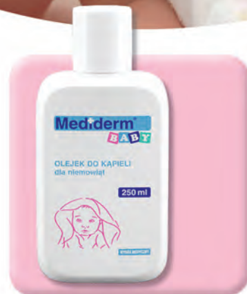
▶ OLEJ DO KĄPIELI