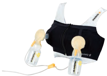
Corset do odciągania pokarmu. Wygodne odciąganie pokarmu bez angażowania rąk. Specjalna konstrukcja bez fiszbin, z zabezpieczeniem antypoślizgowym, utrzymuje gorset na właściwym miejscu. MEDELA, medela.com