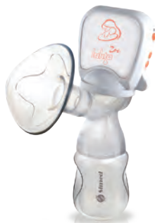
Laktator elektryczny LAKTA ZOE z wbudowanym akumulatorem pozwala na pracę urządzenia bez użycia baterii. Laktator imituje naturalny rytm ssania dziecka w trybie 2-fazowym: stymulacji oraz głębokiego odciągania. 5-stopniowa regulacja poziomów mocy pozwala dopasować czas i moc do indywidualnych potrzeb kobiety. OK. 158 zł, SIMED PPH, simed.pl