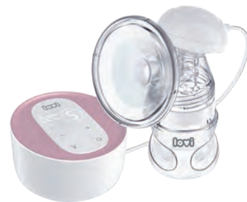
LOVI Prolactis 3D SOFT. Twój przyjaciel w karmieniu piersią. Idealny dla mam, poszukujących laktatora, który pozwoli im w sposób delikatny i skuteczny odciągnąć mleko, aby nie musiały rezygnować ze swoich planów. Posiada innowacyjny lejek 3D – najbliższy naturze, który nie tylko ssie, ale przede wszystkim uciska brodawkę podobnie jak usta i język dziecka powodując naturalny wyptyw mleka. LOVI, lovi.pl

L aktacja ma na celu dostarczenie dziecku przez matkę składników pokarmowych i przeciwciał odpornościowych. Buduje również więź matki z dzieckiem. W trakcie trwania ciąży dochodzi do systematycznej przebudowy gruczołu piersiowego, co w rezultacie skutkuje tym, że pod koniec ciąży każda z piersi przybiera na masie ok. 400 gramów. Sam przebieg procesu laktacji jest uzależniony od układu hormonalnego – od podwzgórze i przysadki.