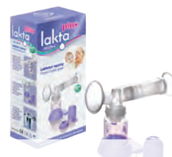
LAKTATOR LAKTA PLUS – „Niezwyczajnie skuteczny dzięki dużej sile ssania” Cena ok. 33 zł