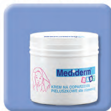
▶ KREM NA ODPARZENIA PIELUSZKOWE