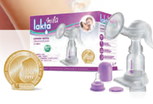
LAKTATOR LAKTA MILA – wyróżniony w plebiscycie „Złoty Brzuszek 2015” Cena ok. 39 zł (w zestawie adapter do butelki szerokotworowej)