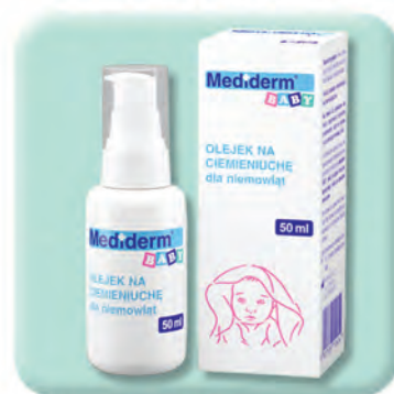
▶ OLEJ NA CIEMIENIUCHĘ