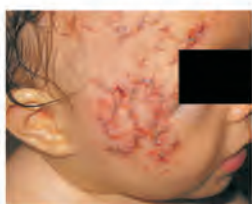
po 12 tygodniowym leczeniu