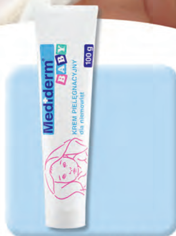
▶ KREM PIELĘGNACYJNY