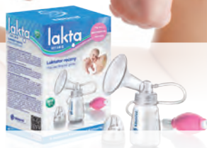
LAKTATOR LAKTA – „Sprzyja prawidłowej laktacji, do sporadycznego stosowania” Cena ok. 26 zł

Producent: SIMED PPH ul. Estrady 130 01-932 Warszawa www.simed.pl