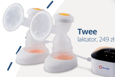
Twee laktator, 249 zł