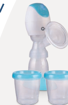
Fidi laktator, 149 zł