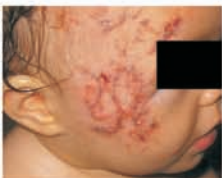
po 12 tygodniowym leczeniu