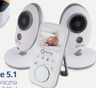
Babyline 5.1 niania elektroniczna 349 zł