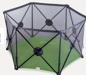
Noor kojec, 219 zł

Pakiet gwarancyjny dla Twojego komfortu!