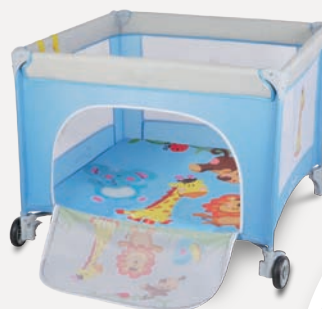
Stella kojec/tóżeczko, 199 zł