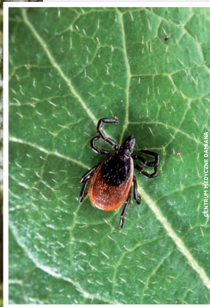
CENTRUM MEDYCZNE DANIANA