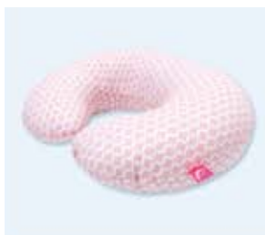
fasolki poduszki do karmienia