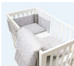
pościelie z ochraniaczem na rzepy